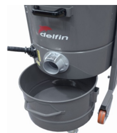
Cuve détachable et structure entièrement en acier peint époxy