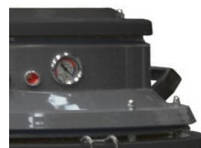
Indicateur de colmatage du filtre