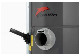
Système de secouage pour décolmatage du filtre par l'extérieur