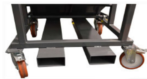
Système de vidange: Enfourchable par un chariot élévateur