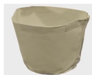
Filtre polyester à poussière