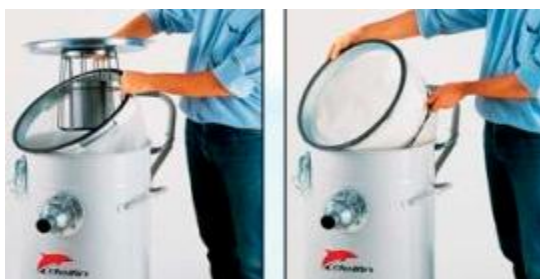
Flotteur et filtre PPL pour les liquides