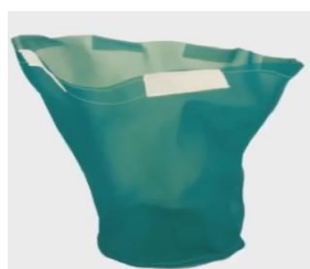
Filtre à liquide